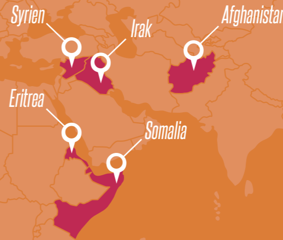
De flesta flyktingar som flydde till Sverige i början av 2014 kom från Syrien, Eritrea, Somalia, Afghanistan och Irak.

– Integration är inte en envägskommunikation, det behövs människor att samspela med. Där kan alla göra skillnad, oavsett om det är genom idrottsrörelsen, skolan, föreningslivet, näringslivet eller på andra sätt.